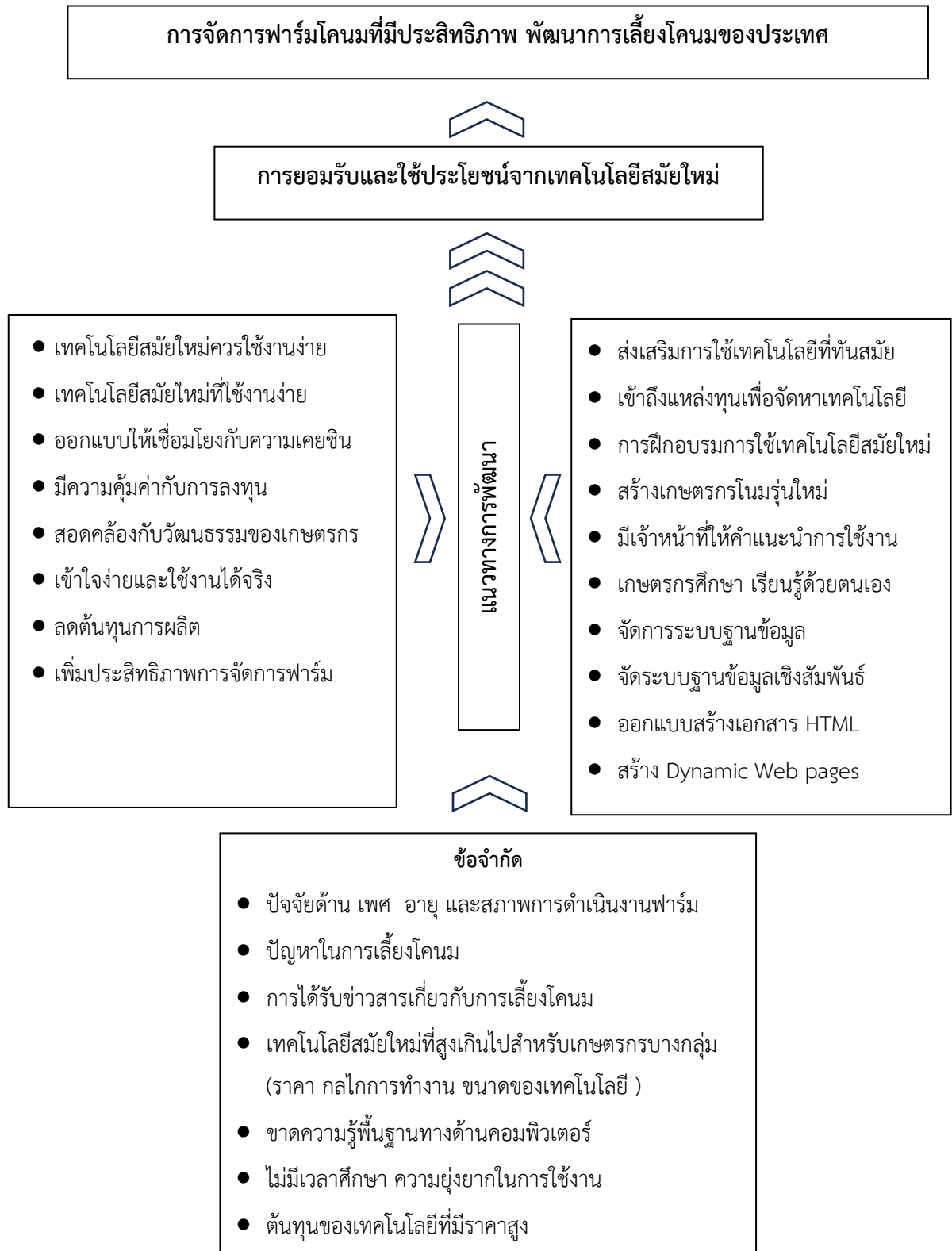
ภาพที่ 3 แสดงแนวทางการพัฒนาการจัดการฟาร์มโคนมที่มีประสิทธิภาพเพื่อพัฒนาการเลี้ยงโคนมของประเทศโดยใช้เทคโนโลยีสมัยใหม่